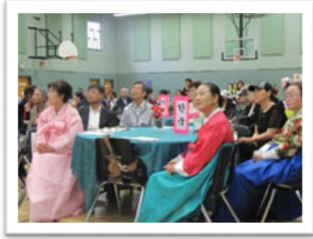
<아시아 노인학대 인식예방의 날 기념 행사진 / 2014 년 6 월 14 일>