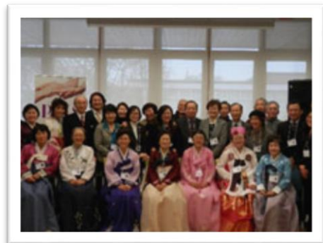
<동료지도자 트레이닝 수료식 / 2013 년 11 월 23 일>