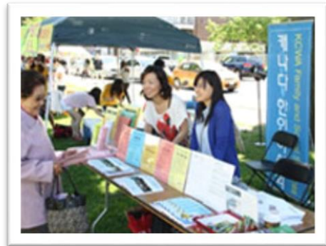
<커뮤니티 아웃리치 이벤트참석 : 총 6 회 (OKBA Trade Show, BF-Hub Open House Event, 단오제, 한가위축제 등)