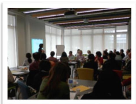
<2 단계 트레이닝 : 42 명 등록 / 31 명 수료>