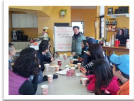
<아웃리치워크숍 :총 6 회 진행/77 명 참석>