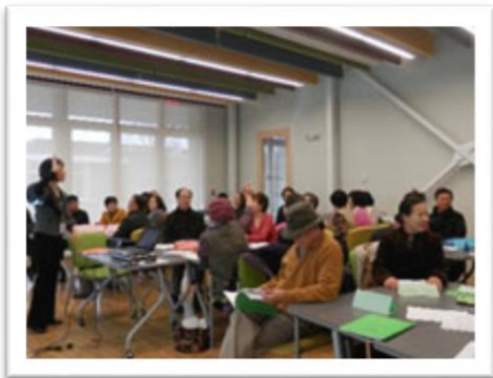
<1 단계 트레이닝 : 54 명 등록 / 42 명 수료>