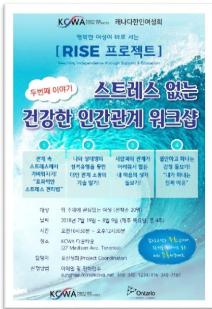
<스트레스없는 건강한 인간관계 세미나 : 총 8 회 / 127 명 참가>