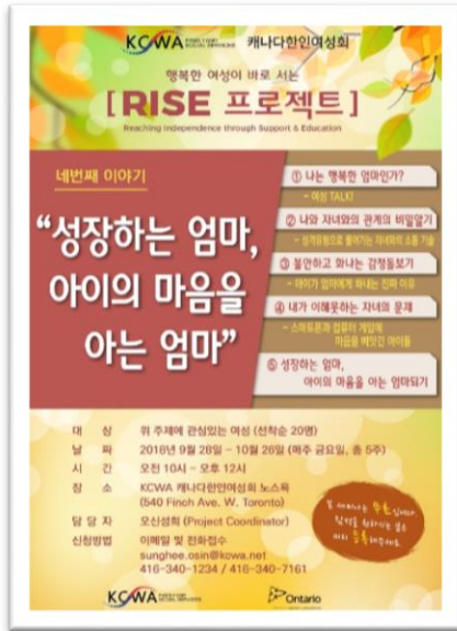
<성장하는 엄마, 아이의 마음을 아는 엄마 세미나 : 총 34 회 / 363 명 참가>